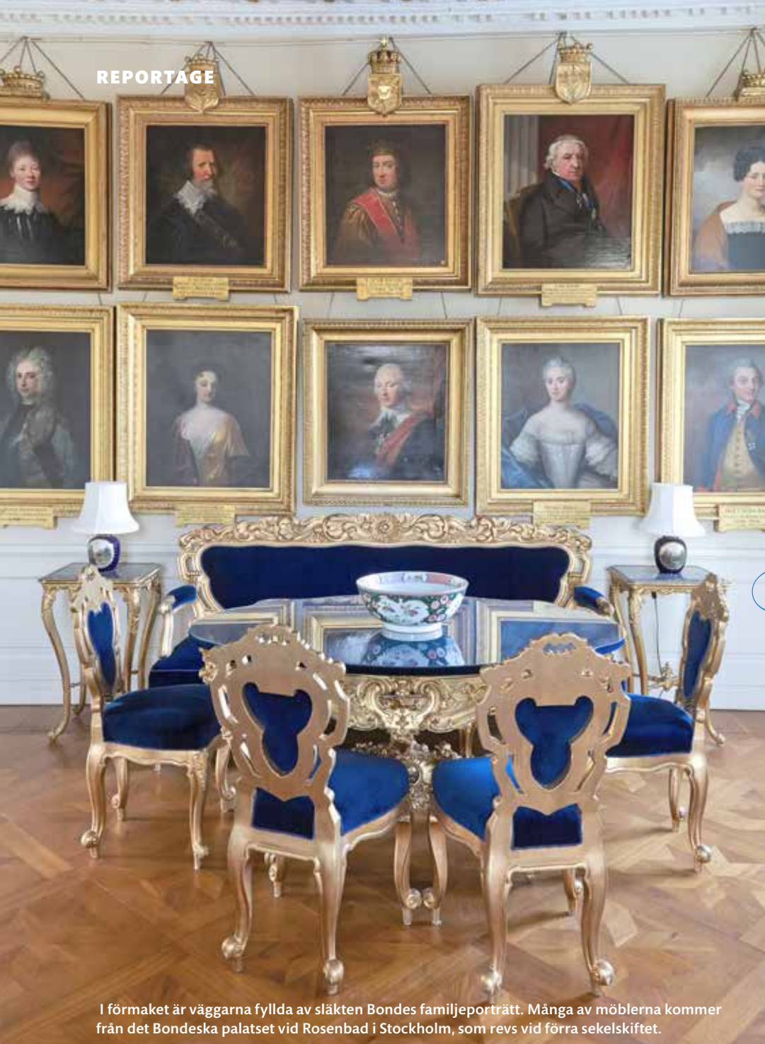
I förmaket är väggarna fyllda av släkten Bondes familjeporätt. Många av möblerna kommer från det Bondeska palatset vid Rosenbad i Stockholm, som revs vid förra sekelskiftet.