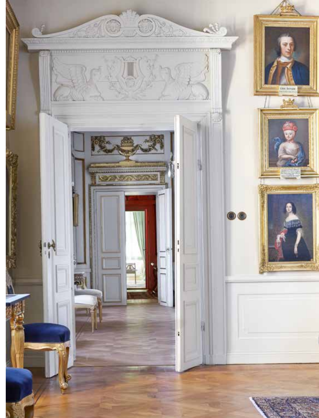
Släkten Bonde har ägt slottet sedan 1808 och salarna rymmer många historiska föremål.