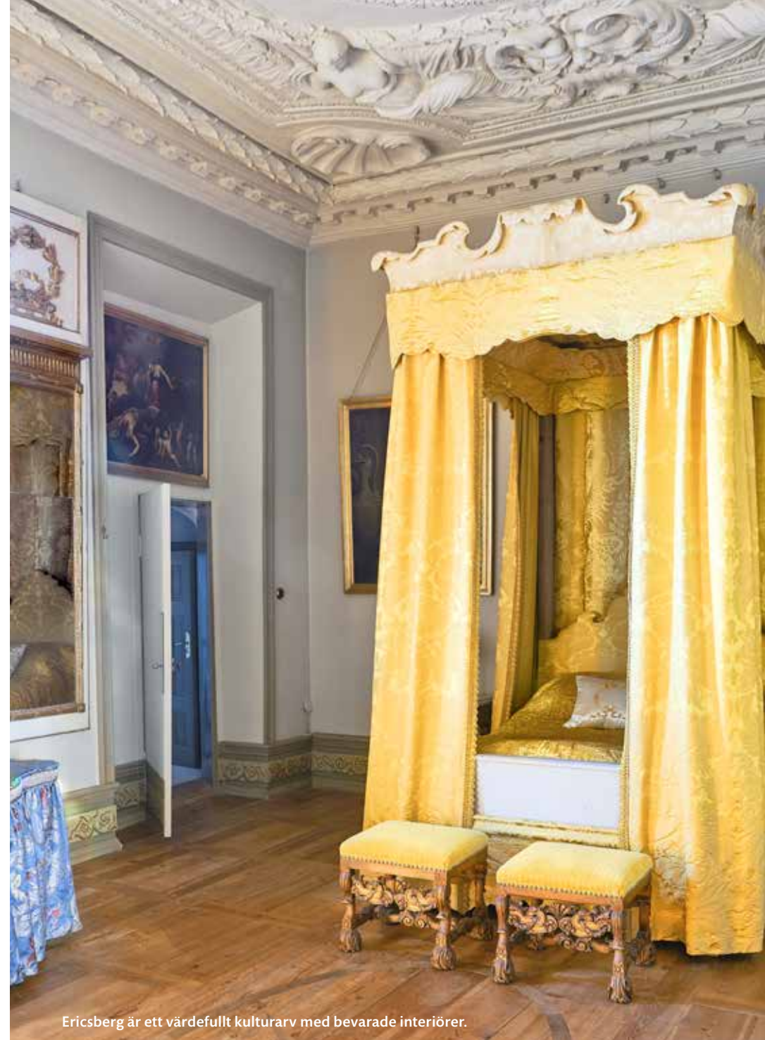
Ericenberg är ett värdefullt kulturarv med bevarade interiörer.