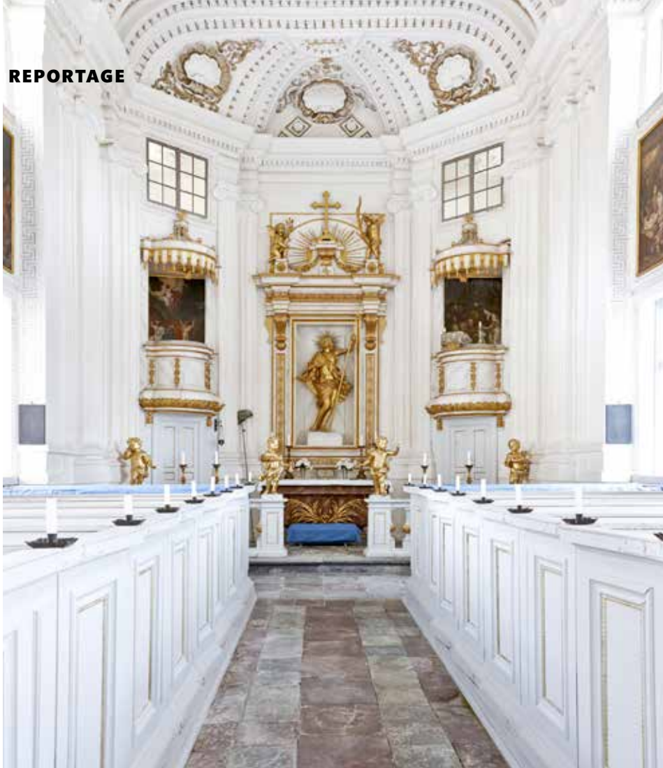
Det unika kapellet inne i slottet har pelare med dekorativa kapital och en altartavla i form av en förgylld skulptur som omgärdas av två utsmyckade balkonger varav den ena är predikstol.

> det! Jag och en kompis hade varsin häst i det gamla stallet och red tillsammans varje dag efter skolan. Jag hade ofta kompisar på besök och parken var en perfekt lekplats med labyrinten, stigar och klätterträd.