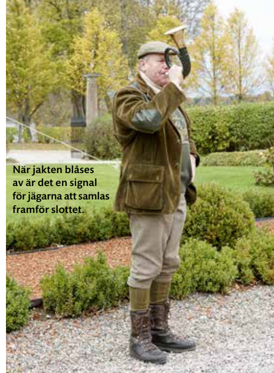
När jakten blåses av är det en signal för jägarna att samlas framför slottet.