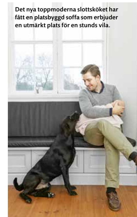
Det nya toppmoderna slottsköket har fått en platsbyggd soffa som erbjuder en utmärkt plats för en stunds vila.