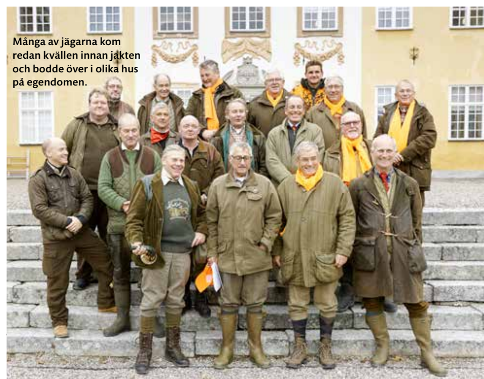
Många av jägarna kom redan kvällen innan jakten och bodde över i olika hus på egendomen.

Ericenberg säljer även en hel del pyrsch- och drevjakter, ibland över flera dagar med möjlighet till kost och logi. Om sommaren kan man delta i nattlig jakt på vildsvin och ägna dagen åt exempelvis fiske. >