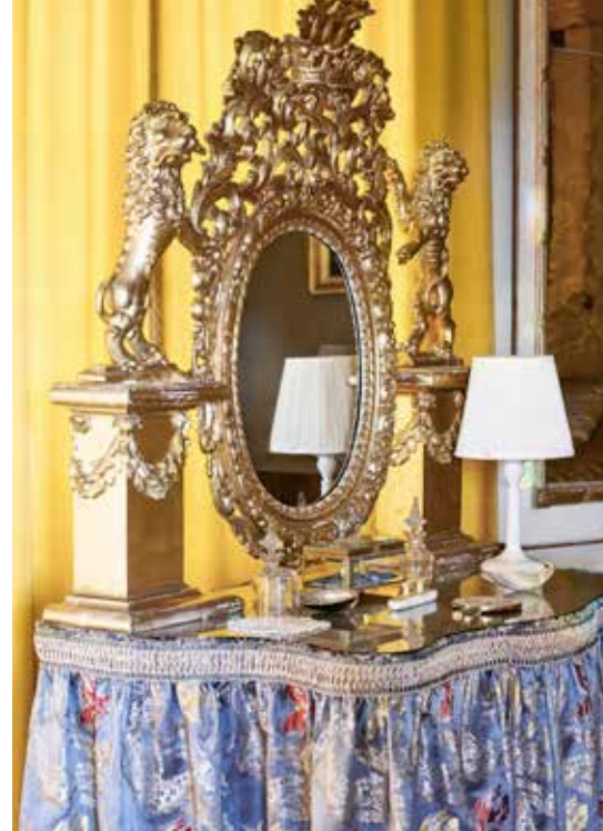
En sagolik förgylld spegel pryder toalettbordet i ett av gästrummen.