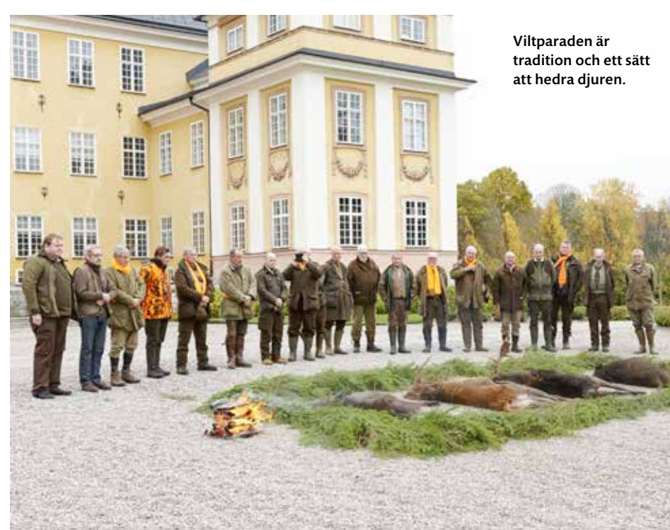
Viltparaden är tradition och ett sätt att hedra djuren.