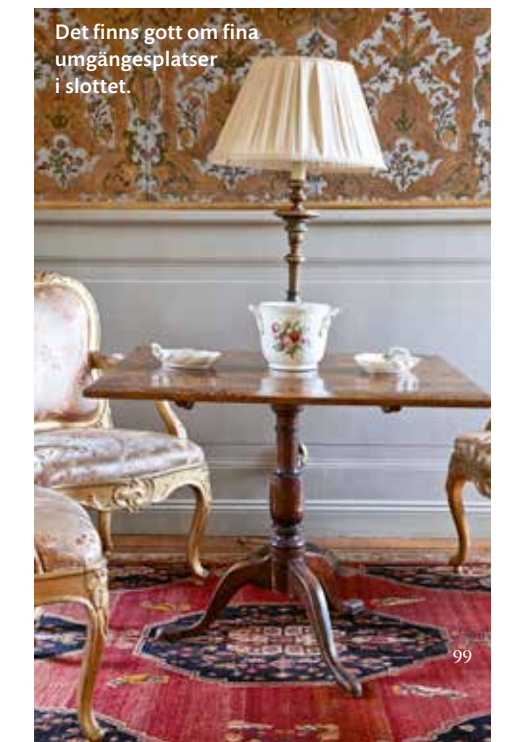
Det finns gott om fina umgängesplatser i slottet.