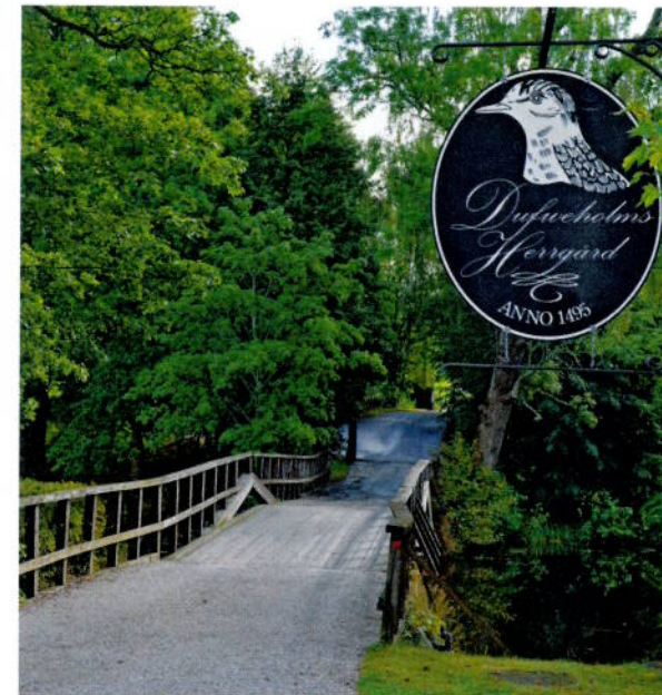
Dufweholms Herregård anno 1495 ligger idyllisk til på en liten øy ved en av Sörmlands mange innsjøer. Adressen er Herregårdsvegen 16 A, og vi befinner oss like utenfor Katrineholm, under to timers kjøring fra Stockholm.