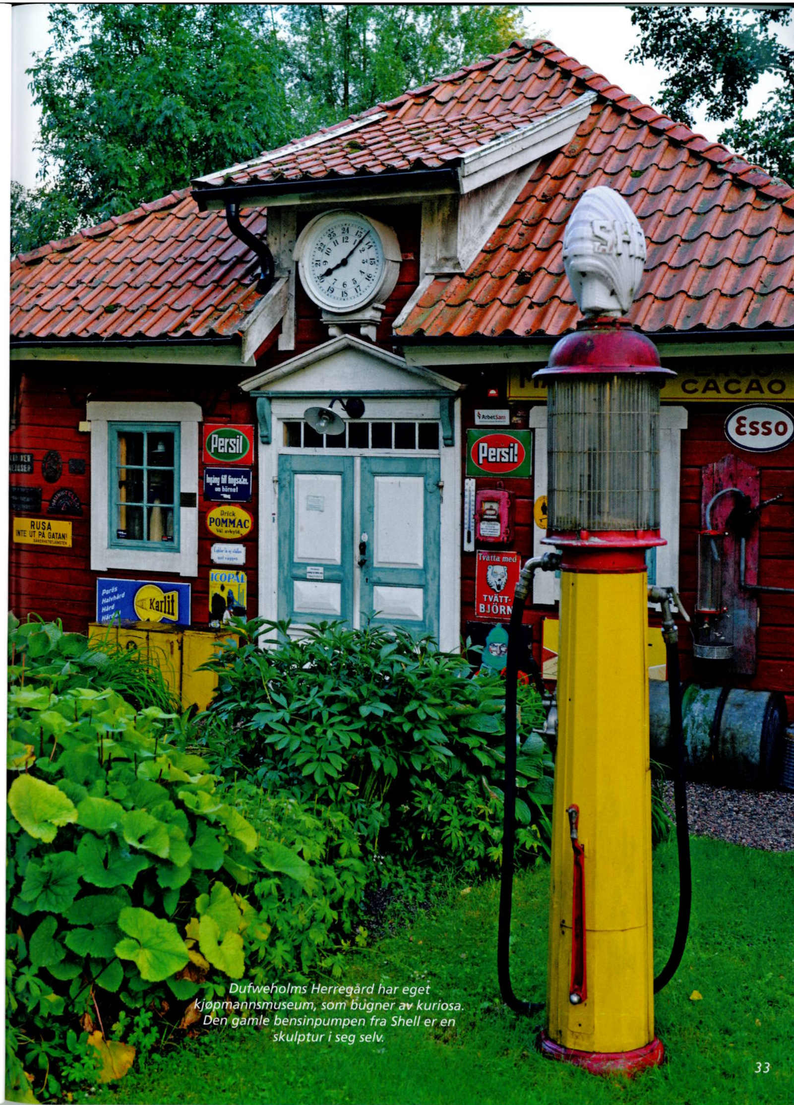
Dufweholms Herregård har eget kjøpmannsmuseum, som bürger av kuriosa. Den gamle bensinpumpen fra Shell er en skulptur i seg selv.