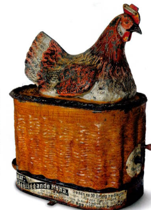
Den rugende hønen i metall er visstnok Sveriges første sjokoladeautomat, fra 1884. Man puttet på en tioring og derved kom et pent litografert metallegg med sjokolade ut bak høna.

Du som jakter antikviteter bør også besøke Møbelmagasinet i Katrineholm. Her er 1500 kvm stappet med antikviteter, ting og tang i alle kvaliteter. Du finner det i Fabriksgt 1, i en gammel industribygning. Det vil forundre meg om du går tomhendt derfra. Tlf: + 46 150 514 40.