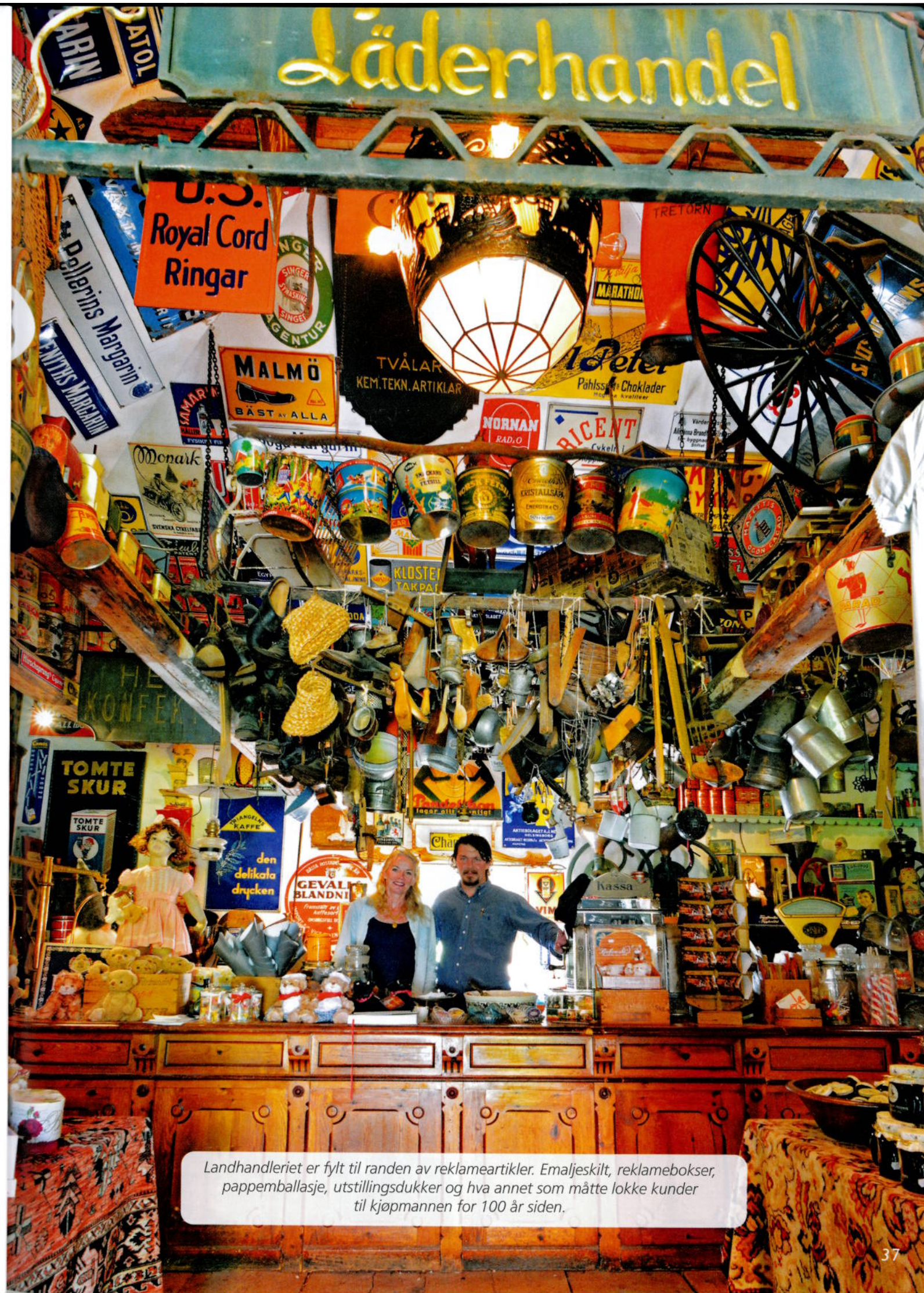
Landhandleriet er fylt til randen av reklameartikler. Emaljeskilt, reklamebokser, pappemballasje, utstillingsdukker og hva annet som måtte lokke kunder til kjøpmannen for 100 år siden.