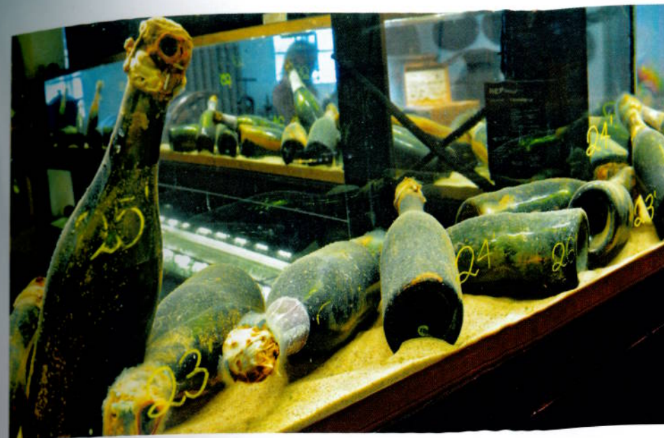
Hvert år i november arrangeres champagnehelg på Dufweholm. Da kan man nyte en 7-retters gourmetmeny samt smake på "historiske perler", som tilbrakte 80 år på havets bunn.