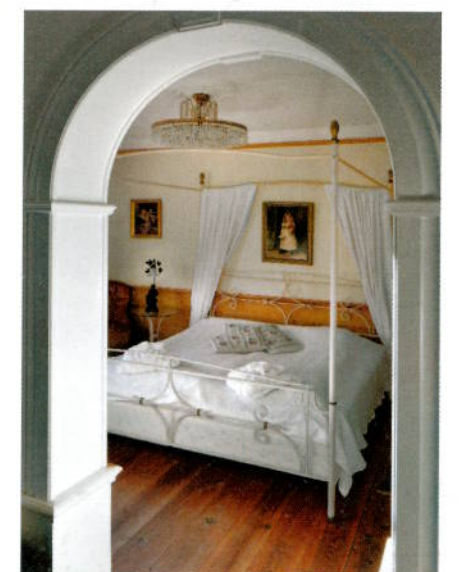
Soverommene er som seg hør og bør på en herregård; Himmelske.