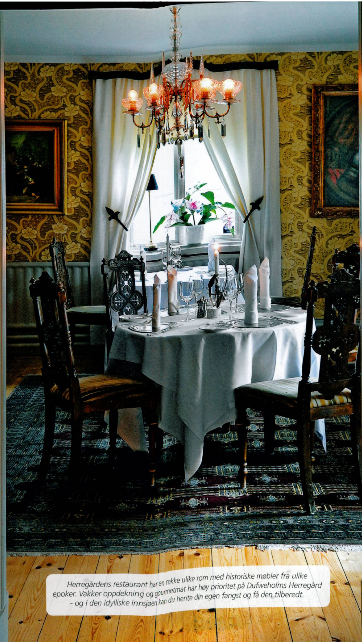
Herregårdens restaurant har en rekke ulike rom med historiske møbler fra ulike epoker. Vakker oppdekning og gourmetmat har høy prioritet på Dufweholms Herregård - og i den idylliske innsjøen kan du hente din egen fangst og få den tilberedt.