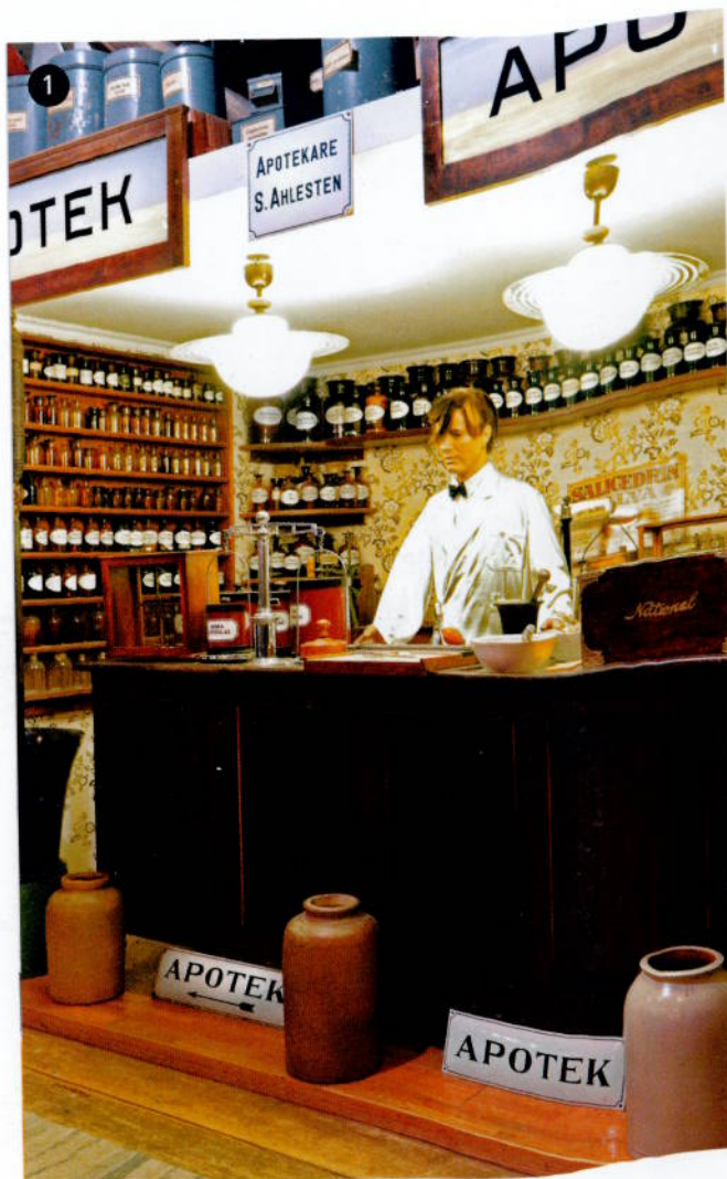
1) Museet har også sin egen apotekeravdeling.