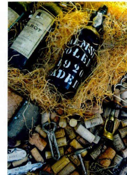
I vinkjelleren er det flust med antikke vinflasker og åpnerer, samt korker fra fortærte godsaker. Det finnes en rekke antikke drikkevarer man kan smake på, samt en unik samling av Armagnac.